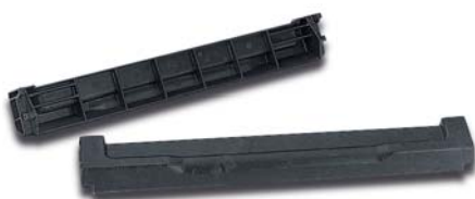
Планки для штабелирования вкладываемых контейнеров