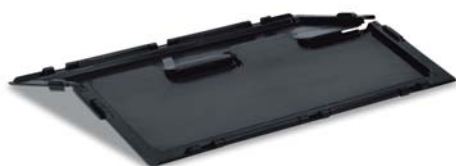
Крышка на петлях, 2-створчатая