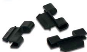
Петли к крышке