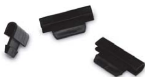
Петли к крышке