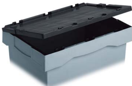
Крышка на петлях