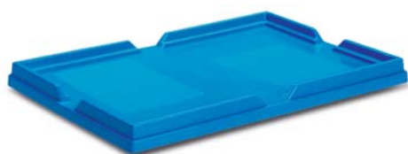
Крышка уплотнительная, 1-створчатая